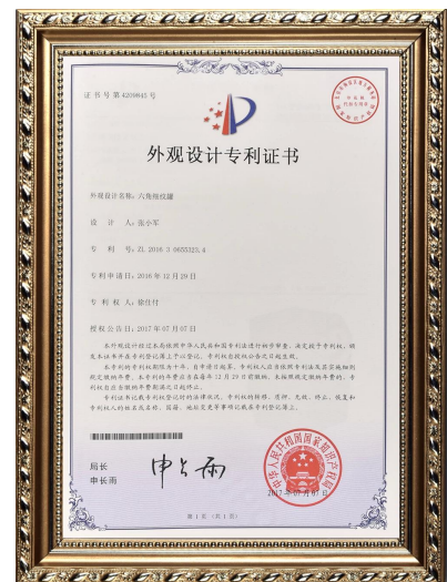
ن براءات الاختراع: 201.630.655.323.4