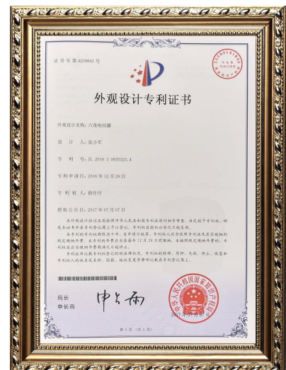
براءة اختراع رقم: 201630655323.4