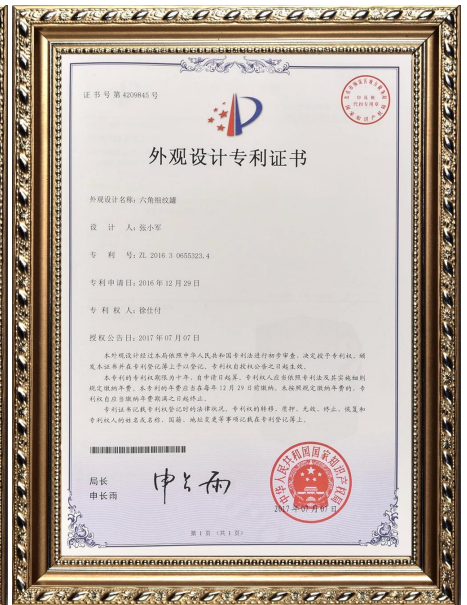
رقم براءة الاختراع: 201630655323.4