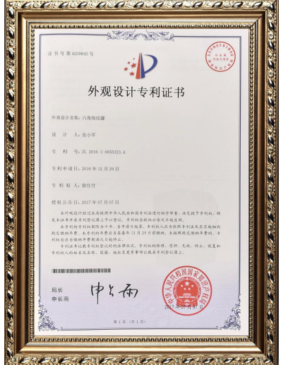
رقم براءة الاختراع: 201630655323.4