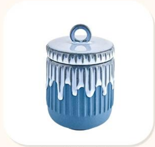
Ceramic Candle jar