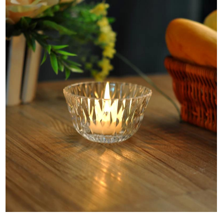
حامل شمعة wholesale الخضم الاقمشه بيركلي