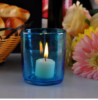
اللون حامل الزجاج شمعة