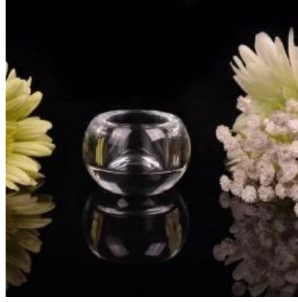
جولة حامل شمعة صغيرة