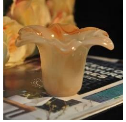
زهرة شكل اسطوانة البشم الأصفر- اللون زخرفة الزجاج حامل شمعة حرة شمعة