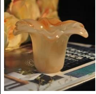
زهرة شكل اسطوانة اليشم الأصفر اللون زخرفة الزجاج حامل شمعة شمعة جرة