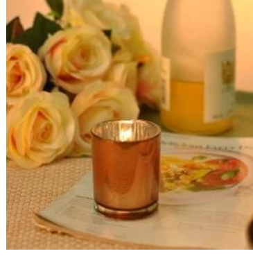
النحاس شمعة جرة 140ml