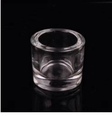
اسطوانة حامل شمعة الخصم الاقمشه بيركلي