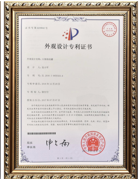
رقم براءة الاختراع: 20163065323.4