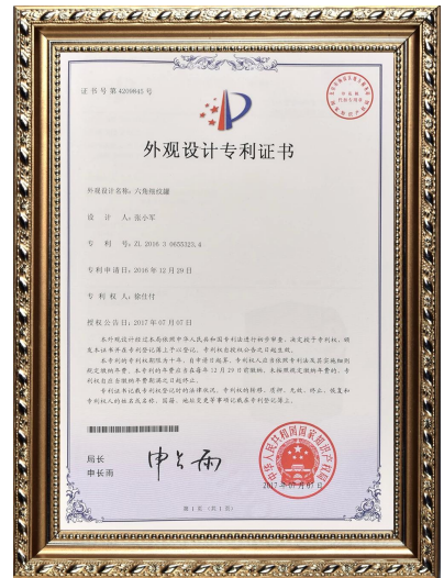
رقم براءة الاختراع: 201630655323.4