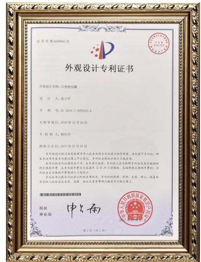
براءة اختراع رقم: 201630655323.4