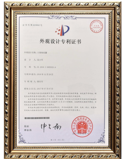
رقم البراءة: 201630655323.4