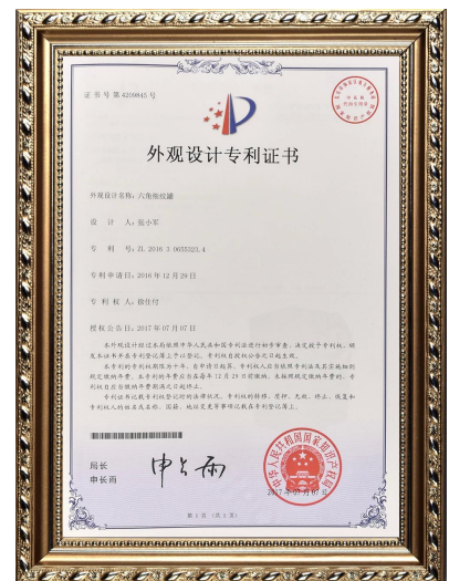
براءة الاختراع رقم: 20163065323.4