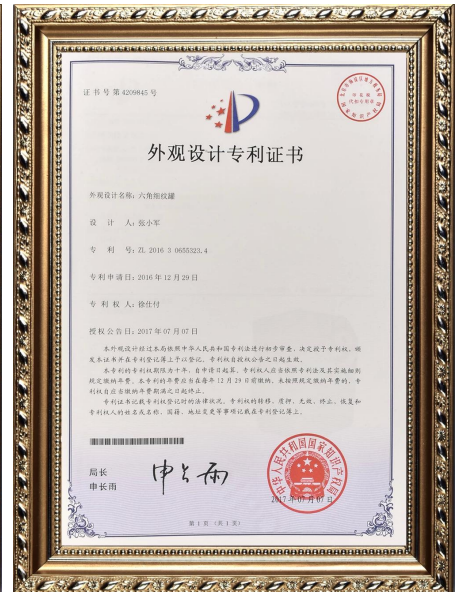
رقم براءات الاختراع: 201630655323.4