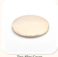
Zinc Alloy Cover