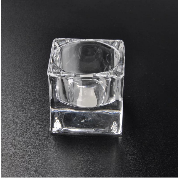
الزجاج حامل شمعة