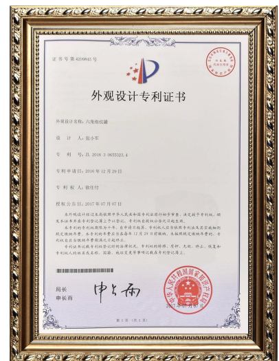
براءة اختراع رقم: 201630655323.4