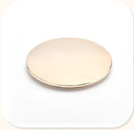
Zinc Alloy Cover