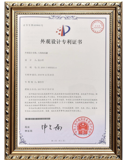
رقم البراءة: 201630655323.4