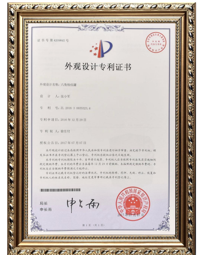
رقم البراءة: 201630655323.4