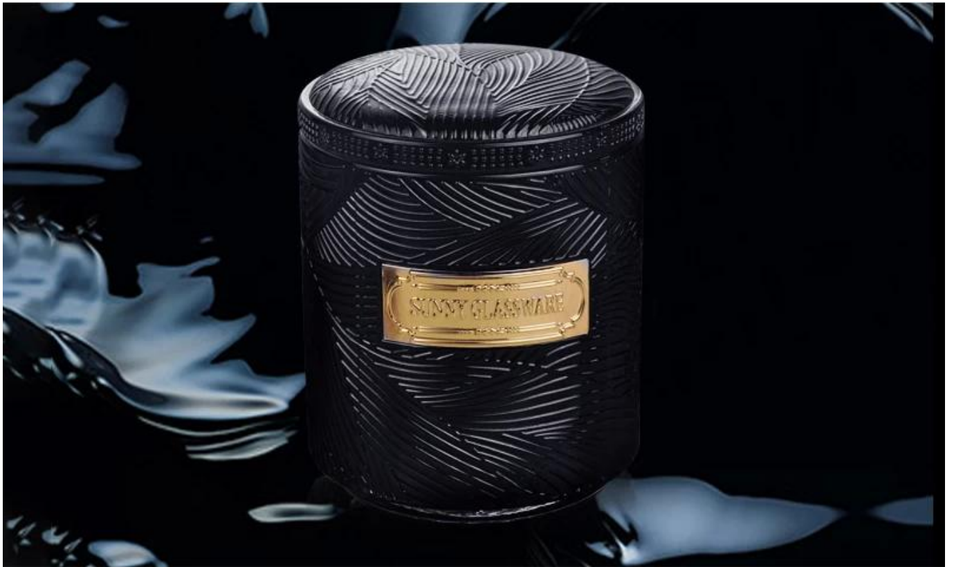
THE STREAM KEEPS COMING