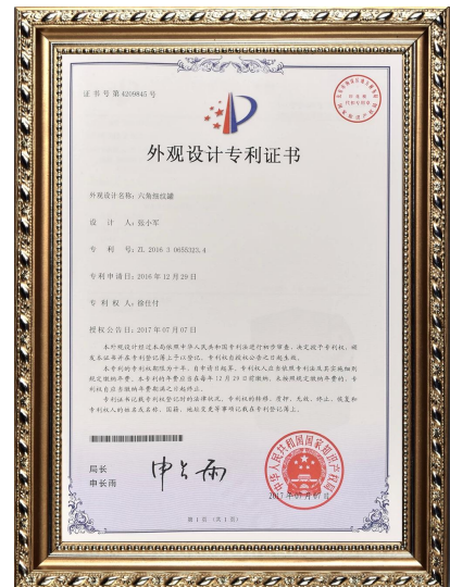
براءات الاختراع 2.20163065523.4