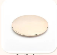
Zinc Alloy Cover