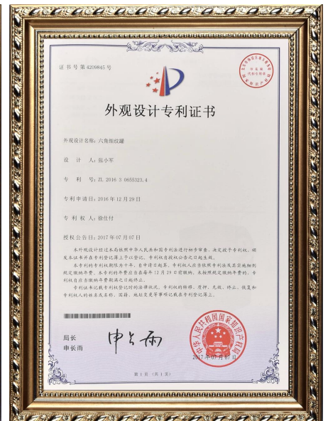
رقم براءات الاختراع: 201630655323.4