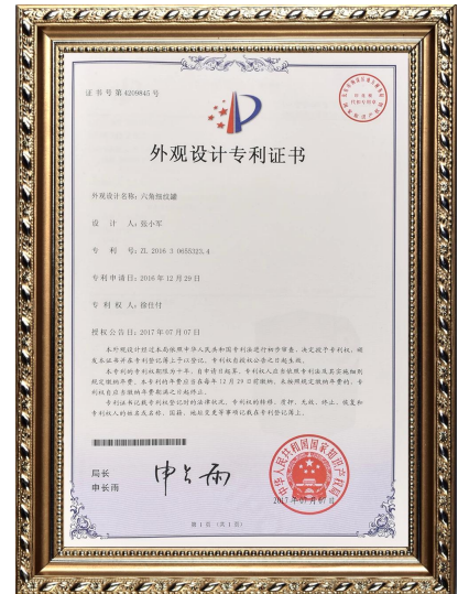
رقم البراءة: 201630655323.4