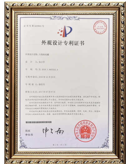
Патентный номер: 201630655323.4