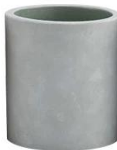
Cement Candle jar