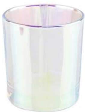
Glass Candle Vessel