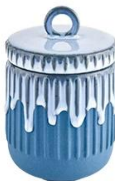
Ceramic Candle jar