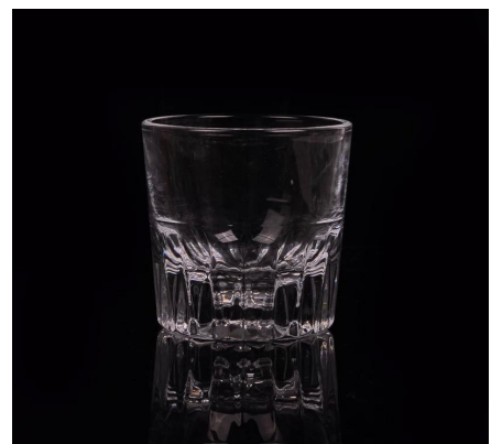
copo de vidro