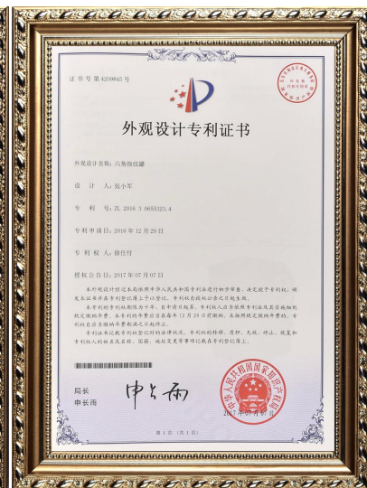
Numer patentu: 20163065523.4