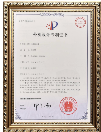
Nr patentu: 201630655323.4