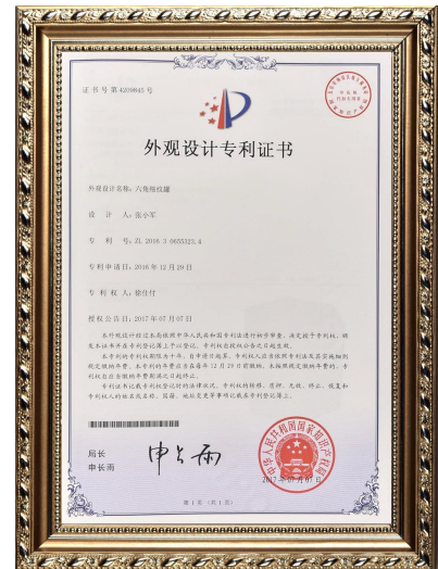
Patent nr: 201630655323.4