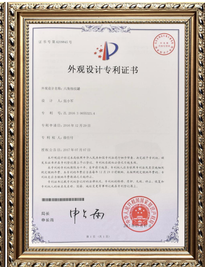
Numer patentu: 201630655323.4