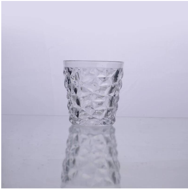
corak pemegang kaca Candler