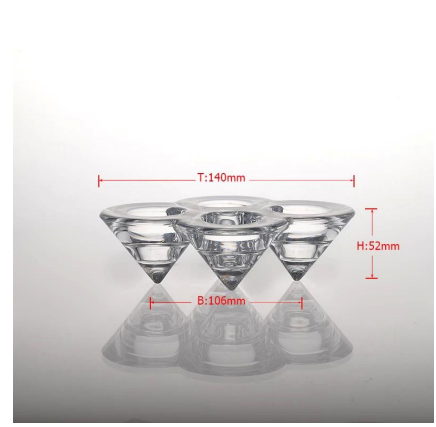
Nazar Tealight kaca telus pusingan kon