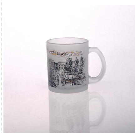
latte tazza di vetro con foto