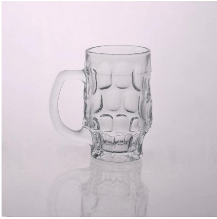
_goffrato boccale di birra