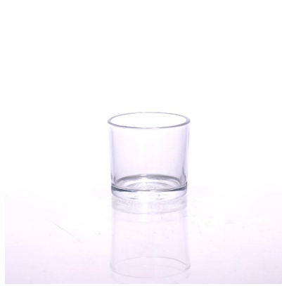
macchina fatta portacandele in vetro