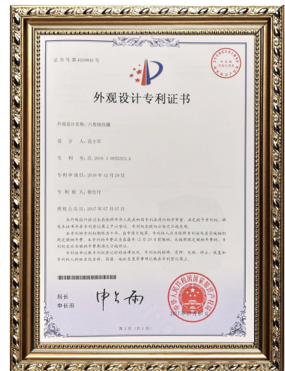
N ° de brevet: 201630655323.4