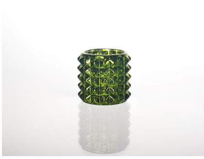
couleur bougie en verre tasse