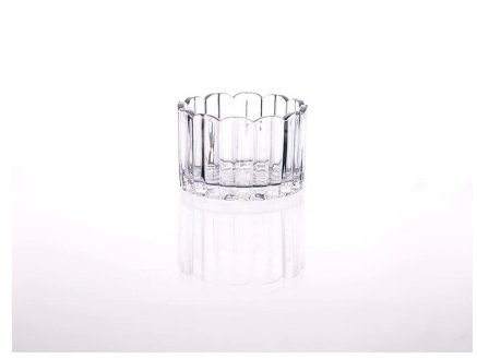
chandelier de verre clair

S Our Company & Sample Room Every day is sunny day