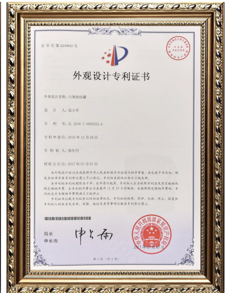
Numéro de brevet: 201630655323.4