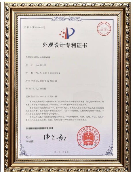
Numéro de brevet: 201630655323.4