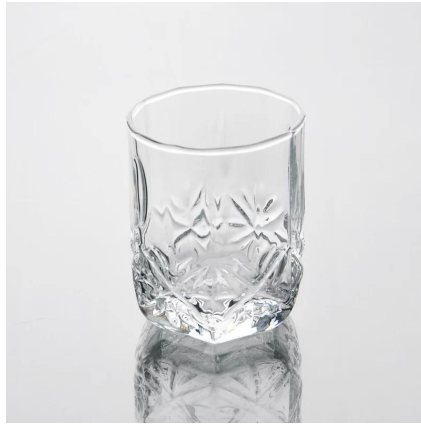
claro vaso de chupito