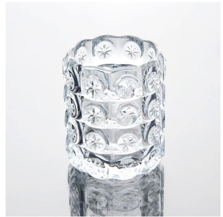
nuevas gafas de diseño tiro