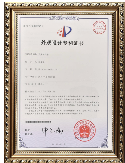
Número de patente: 201630655323.4