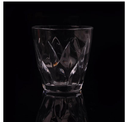
Copa de cristal pesada