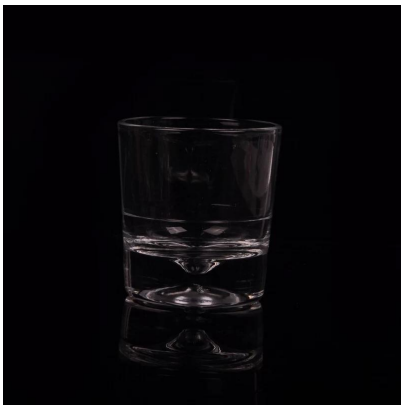
Copa de agua clara