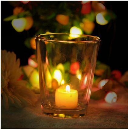
Alta encender velas titular de la forma de V