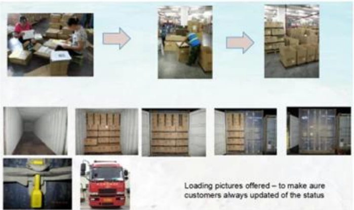
Loading pictures offered – to make sure customers always updated of the status