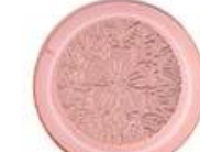
Zinc alloy embossed