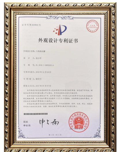
رقم براءة الاختراع: 201630655323.4