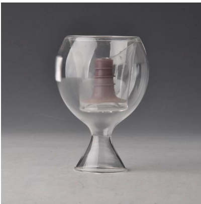
البورسلينات الخاصة كوب زجاج