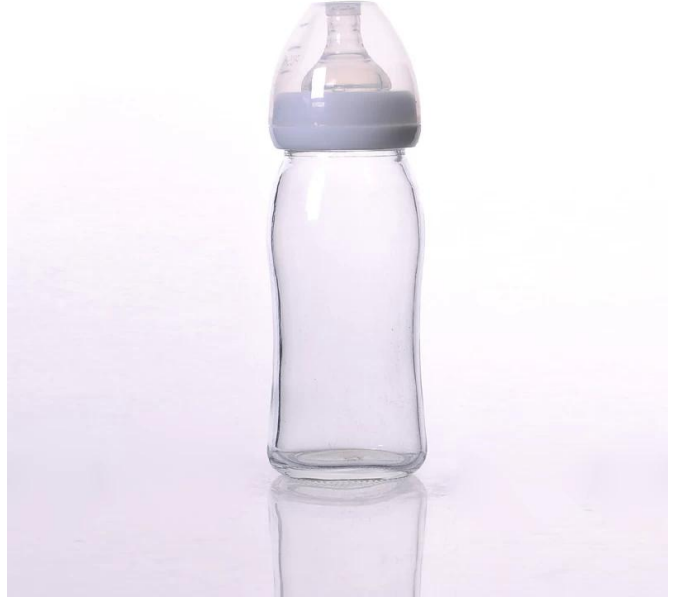
زجاجة الرضاعة بيركس زجاج