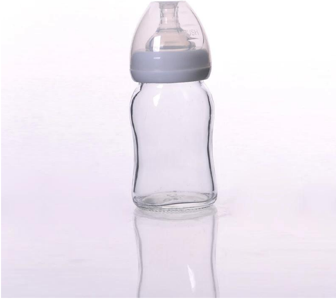
زجاجة الرضاعة بيركس