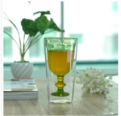
البورسيليكات جدار مزدوج المشروبات الزجاج